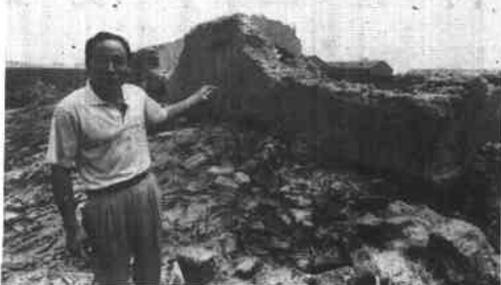
昔日的旧村留给留下这堆残墙。

为适应现代化城市建设的需要，加速居委会经济的发展，进一步改善投资环境，按照市、区指示精神，中王屋村容貌进行了彻底整治，村居总体规划也同时分步实施。