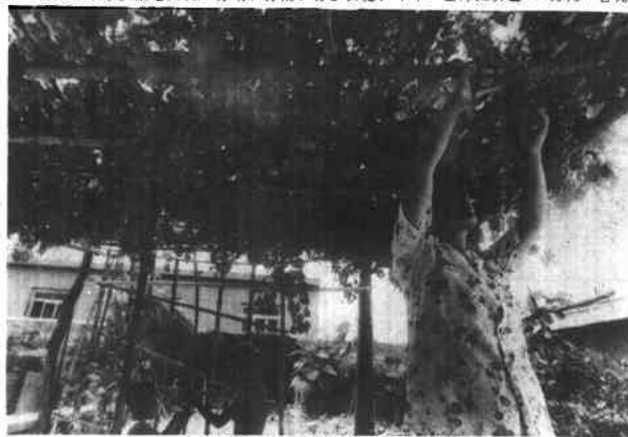
庭院经济在中王屋居委会已蓬勃发展起来。